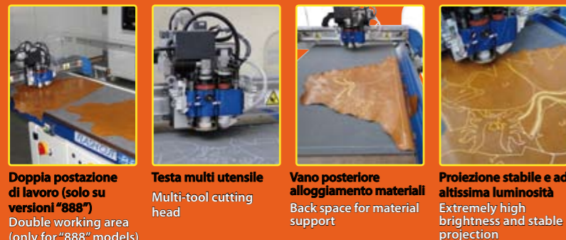
Doppia postazione di lavoro (solo su versioni "888") Double working area (only for "888" models)